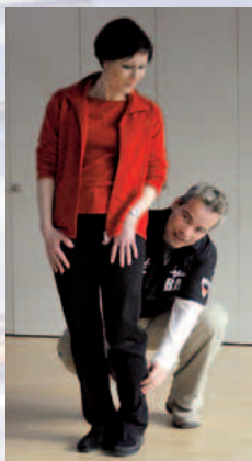
Figaro und Susanne