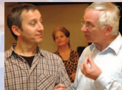
Bartholo und Don Guzman di Stibizia (Probenfoto)

Im Jahr 1778 schrieb der Erfinder, Literat und Spekulant Pierre-Augustin Caron de Beaumarchais (1732-1799) die Komödie «La folle journée, ou Le mariage de Figaro» («Der tolle Tag oder Die Hochzeit des Figaro»), die 1784 in Paris uraufgeführt wurde. Es war nicht nur der Triumph einer genialen Intrigenkomödie, sondern das erste Mal, dass Gesellschaftskritik auf die Theaterbühne gebracht wurde. Der Stoff diente Wolfgang Amadeus Mozart als Vorlage für seine unsterbliche Oper «Le nozze di Figaro» («Figaros Hochzeit», nach dem Libretto von Lorenzo da Ponte), die am 1. Mai 1786 im Wiener Burgtheater uraufgeführt wurde.